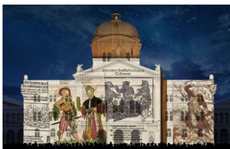
VII Fliegende Blätter Beliebtes Medium der gegenseitigen satirischen Polemik zwischen Protestanten und Altgläubigen und der Volksbelehrung