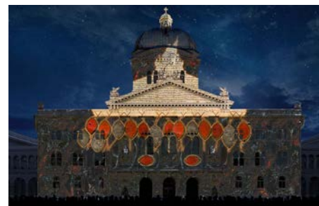
III Ablasshandel, Wittenberger Thesenanschlag Konkreter Anlass und Initialereignis der Reformation