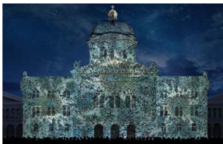
I Zurück zu den Quellen Reformatorisch-humanistischer Leitspruch: Suche nach dem Ursprünglichen, auch Frischen und Befreienden