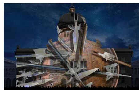
IX Religionskriege Eskalation der Auseinandersetzungen in Kappelerkriegen mit Milchsuppen-Essen als zeitweiligem Waffenstillstand