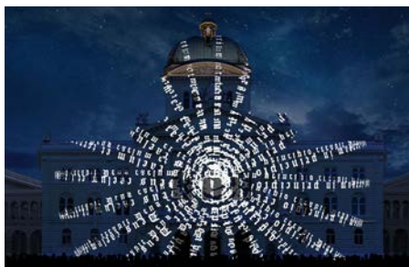
II Das Wort als DAS reformatorische Medium und der Buchdruck mit beweglichen Lettern als Massenmedium der Zeit