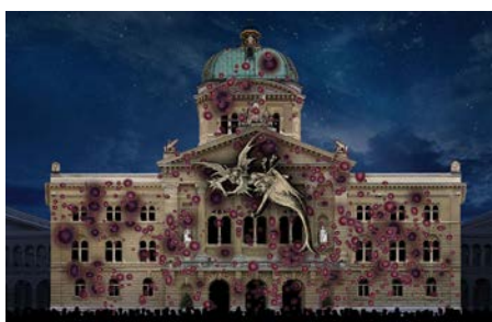
V Die Pest wütet in Europa, auch in Zürich und Bern; Erkrankung und Genesung werden für Zwingli zum persönlichen «Erweckungserlebnis».