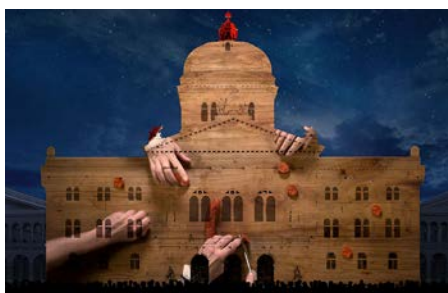
VIII Zürcher Würstessen Provokatives Nachtmahl im Haus des Druckers Froschauer während der Fastenzeit; Ablehnung äusserlicher religiöser Verhaltensnormen