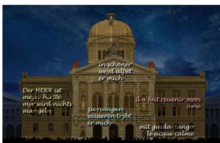
IV Bibelübersetzung Anspruch, die Bibel jedem verständlich in seiner Muttersprache zugänglich zu machen